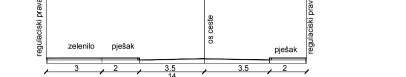
KARAKTERISTIČNI POPREČNI PRESJEK C-C